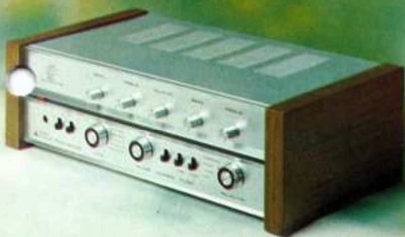
SOLID STATE STEREO VOOR- EN EINDVERSTERKER