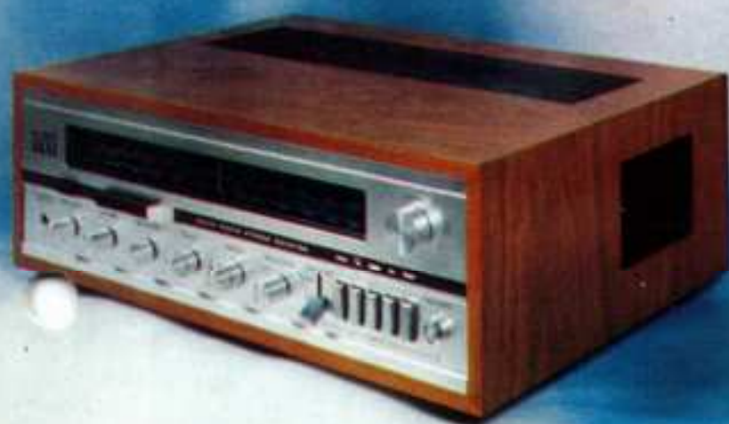
SOLID STATE AM/FM STEREO TUNER-VERSTERKER